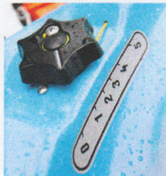
Boréal Baffinin säätöevä toimii kiertokytkimellä.