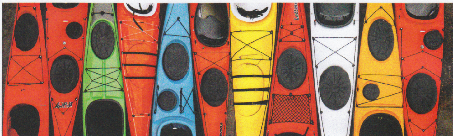
Takanansien vertailua: Star 500, Scorpio LV, Zegul, Aniara, Baffin, Eski 475, Melanie, Meridian, Eski 525, Bigfoot ja Scorpio.