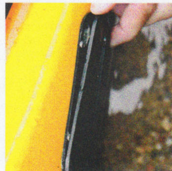
Bigfootin evän säätömekanismi irtoaa helposti.