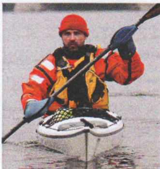
Eskin kannelta puuttuu melaparkki.